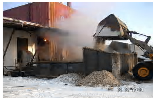
Exergy Bäddtork och panna, Rockhammars Bruk, Sverige

I flera anläggningar används tillsatsbränslen, olja etc., när biobränslet är för vått. Förtorkning eliminerar dessa kostnader.