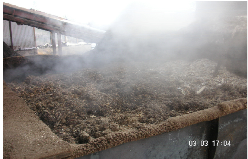
Exergy Bäddtork i drift, Rockhammars Bruk, Sverige.

För konventionell bränsleinmatning behövs bara en fläkt och en värmeväxlare vilka kräver minimalt underhåll och ingen kontinuerlig övervakning. Risker för brand övervakas med temperaturgivare som förreglar tillförseln av varmluft.